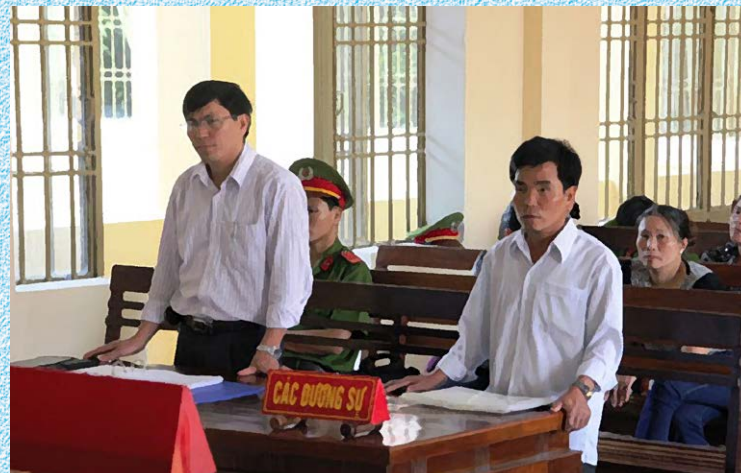
Các đương sự tại Tòa án